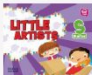
TDL Little Artists Starter