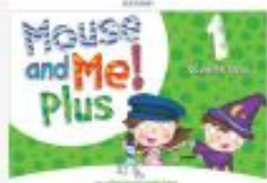
Mouse and me! Plus SB 1