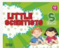
TDL Little Scientists Starter